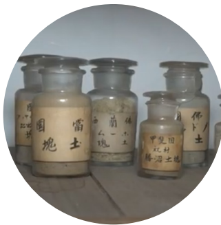
② フランスの土のサンプル