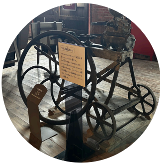
① ワイン作りの機械